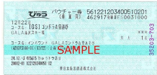
▲空中纜車來回券+玩雪組合商品票