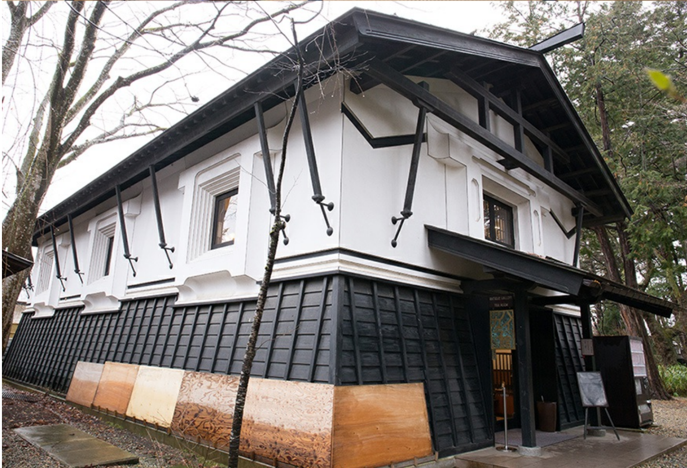
★『北方京都』的平泉・市内典雅的東北第一大名寺【中尊寺】(楓紅期約10月下旬~11月上旬)