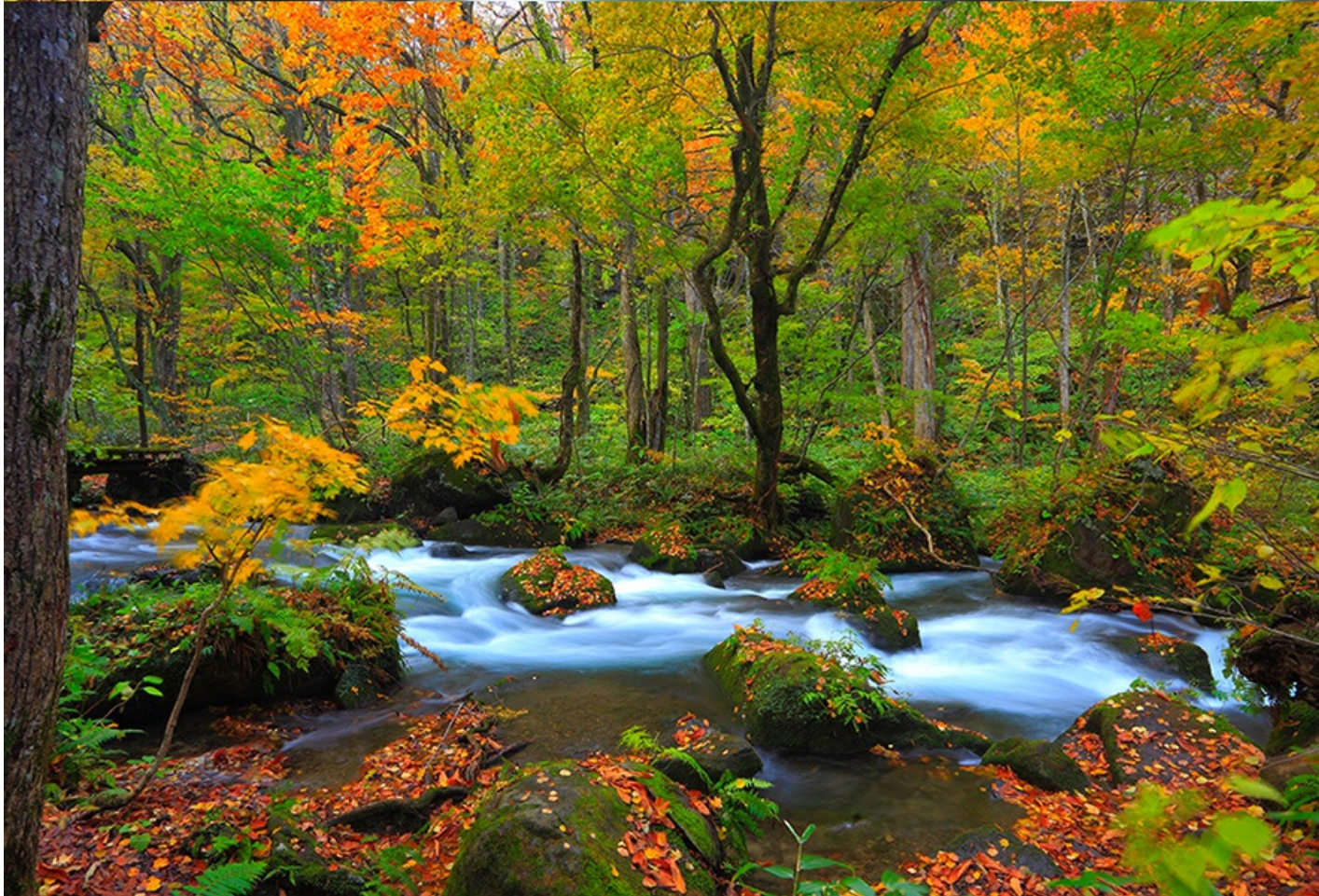
★【城倉大橋】(楓紅期約10月上旬～10月中旬) 或 【蔦沼】(楓紅期約10月中旬～10月下旬)